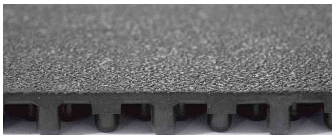
Detailansicht - Profil