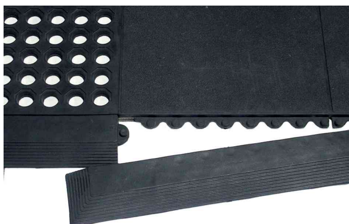
Detailansicht - Abschlussleisten