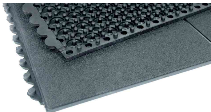
Arbeitsplatzmatte Yoga Solid Oil