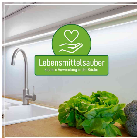
lebensmittelsauber - sichere Anwendung in der Küche