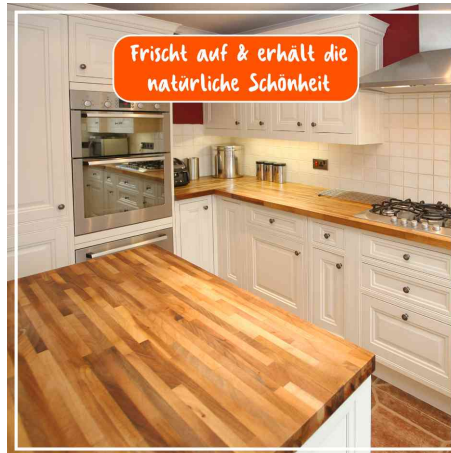
frischt auf & erhält die natürliche Schönheit