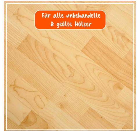
für alle unbehandelten & geölte Hölzer