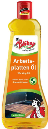
Arbeitsplatten Öl, 500 ml