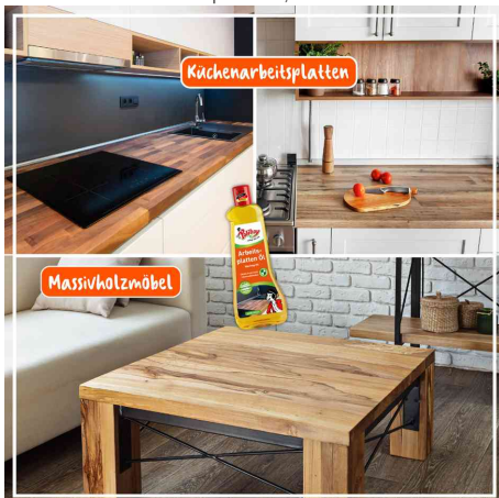
für Küchenarbeitsplatten & Massivholzmöbel