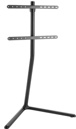
TV-Ständer, V-Fuß, schwarz