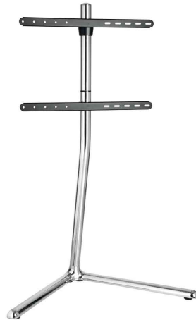
TV-Ständer, V-Fuß, chrome