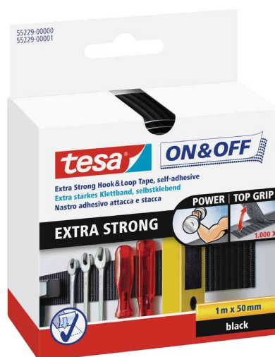
On & Off Klettband Extra Strong