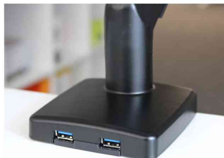
Detailansicht: USB Hubs