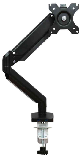
TFT-/LCD-Monitorarm ERGO ONE

Der Monitor-Tragarm ERGO ONE ist ein wertvoller Beitrag zu einem gesundheitsschonenden Arbeitsplatz. Ergonomischer Komfort beginnt mit der richtigen Höheneinstellung des Bildschirms.