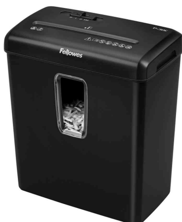
Aktenvernichter Powershred P-30C