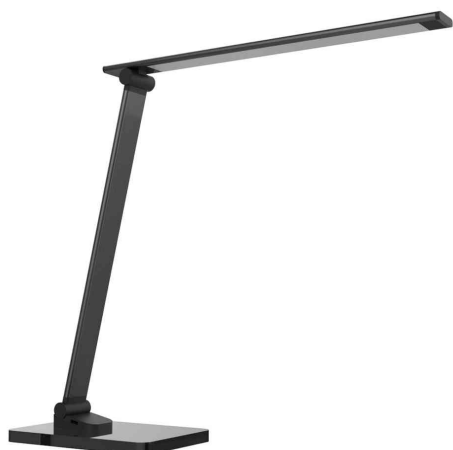
LED-Tischleuchte POPY, schwarz

- ob zum Arbeiten, Lesen oder Entspannen - die Leuchte gibt eine Beleuchtung nach Maß