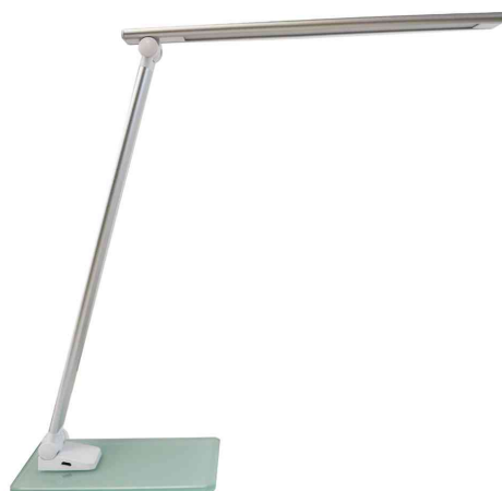
LED-Tischleuchte POPY, silber