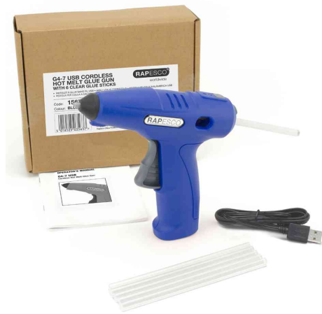
Lieferumfang: Akku-Heißklebepistole G4-7 + Kabel + Patronen