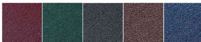
weinrot - grün - grau - braun - blau