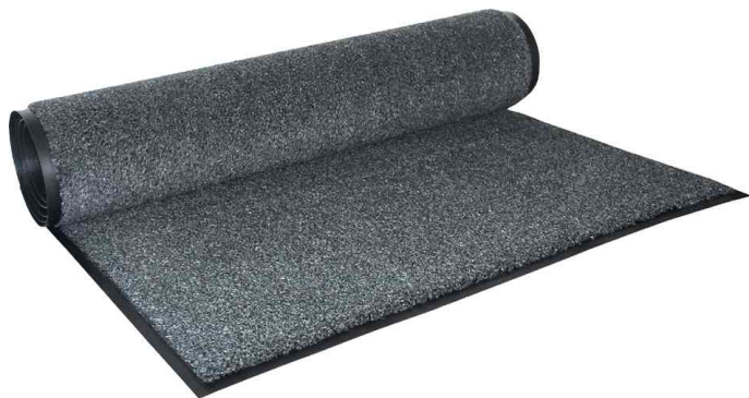
Schmutzfangmatte EAZYCARE AQUA