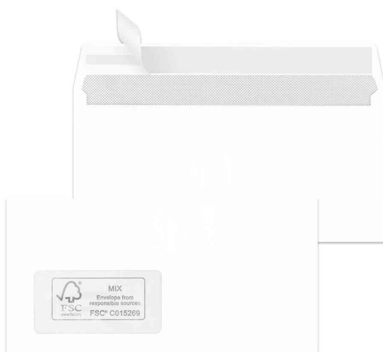
Briefumschlag DIN lang, mit Fenster links