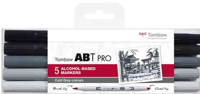
Marker ABT PRO, 5er Set Warm Gray Colors