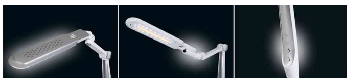
Detailansicht - Leuchtenkopf / Steuerung