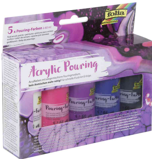
Acrylic Pouring - Intensiv-Farben