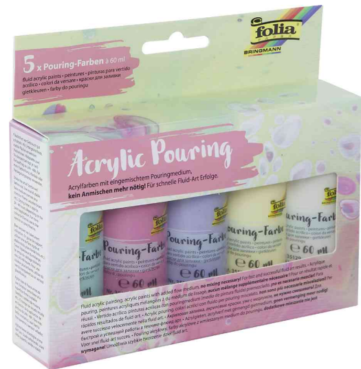
Acrylic Pouring - Pastell-Farben