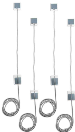
Elastikschnur mit Klebepad Board Lanes