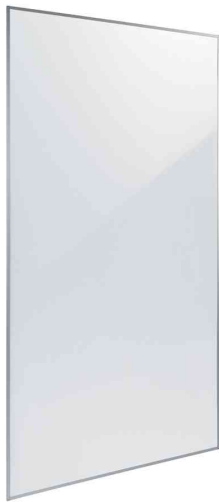
Weißwandtafel Meet up