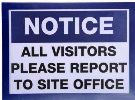
Magnetrahmen DIN A4, blau