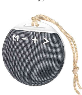
Bluetooth Lautsprecher, mit Trageschleufe