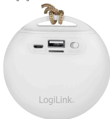
Bluetooth Lautsprecher, mit Trageschleufe - Rückansicht