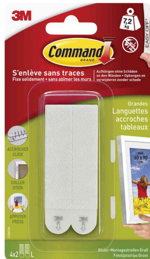
Bilder-Montagestreifen Strips L, weiß