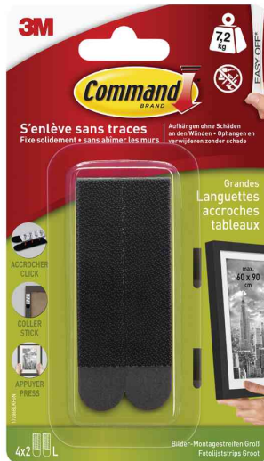
Bilder-Montagestreifen Strips L, schwarz

- geeignet zum Aufhängen von gerahmten Fotos, Bilderrahmen und Grafiken, ohne Schäden an den Wänden zu hinterlassen