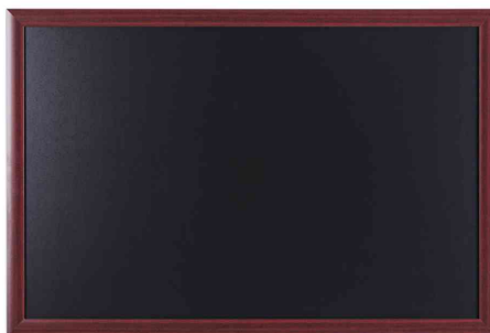
Kreidetafel, mit Rahmen, Kirschoptik