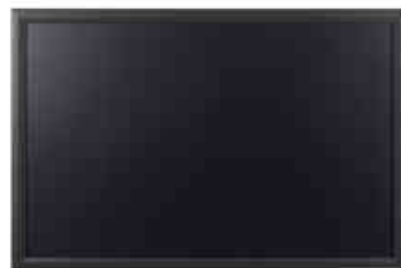
Kreidetafel, mit Rahmen, schwarz