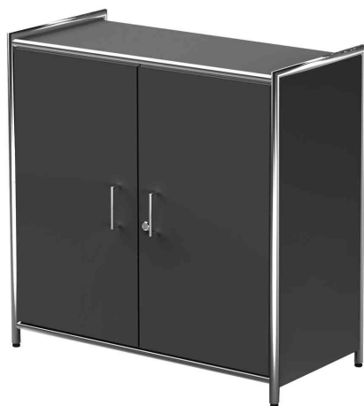
Sideboard ARTLINE, 2 Fächer, anthrazit