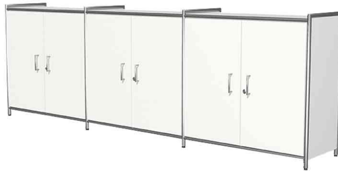
Sideboard ARTLINE, 6 Fächer, weiß