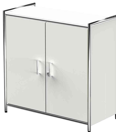
Sideboard ARTLINE, 2 Fächer, weiß