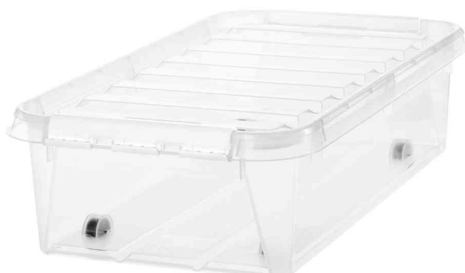
Aufbewahrungsbox CLASSIC 35, weiße Klippverschlüsse