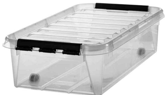
Aufbewahrungsbox CLASSIC 35, schwarze Klippverschlüsse