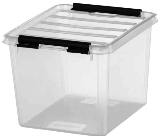
Aufbewahrungsbox CLASSIC 3, schwarze Klippverschlüsse

- Haushalte, Betriebsorganisationen, Kindergärten, Camper, Bauarbeiter, Gastronomie