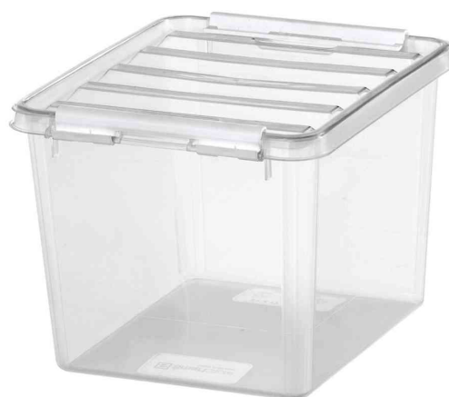
Aufbewahrungsbox CLASSIC 3, weiße Klippverschlüsse