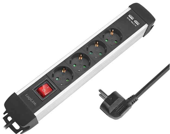
Überspannungsschutz-Steckdosenleiste, 4-fach und 2 x USB - mit Schalter