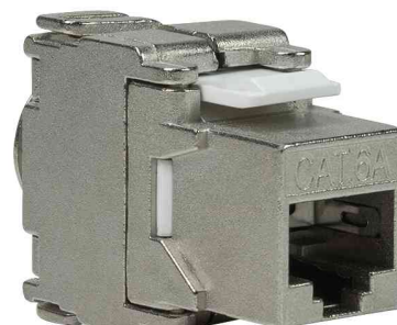
Keystone Modul Kat.6A, Klasse EA, geschirmt, 180° STP Anschluss