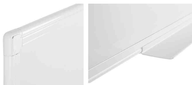
Detailansicht: Aluminiumrahmen, Ablageschale