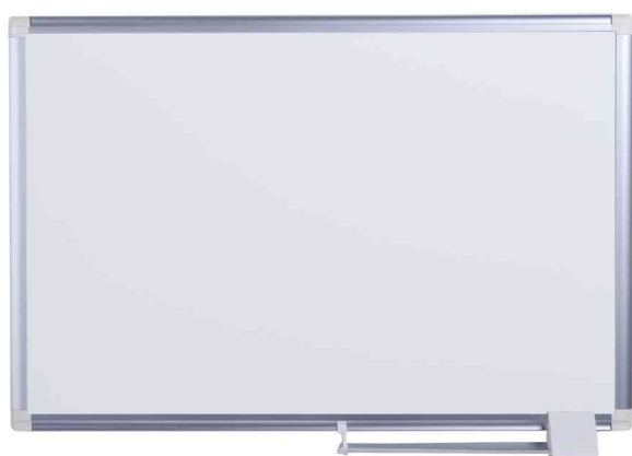
Weißwandtafel "New Generation"