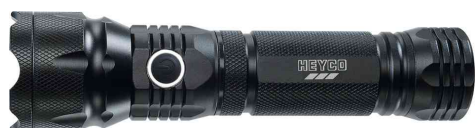
LED-Taschenlampe 3 W