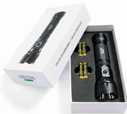
LED-Taschenlampe 3 W, in Verpackung