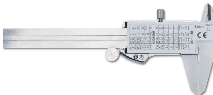
Digitaler Präzisions-Messschieber, Rückseite