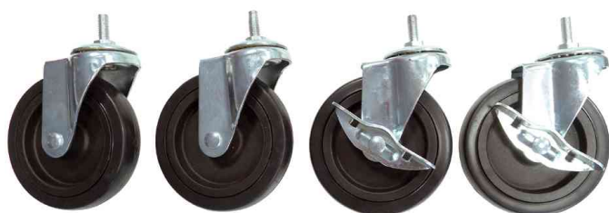
Räder-Set für Multifunktionsregal MOBI