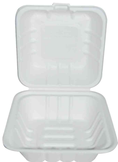
Zuckerrohr-Burgerbox NATURE Star