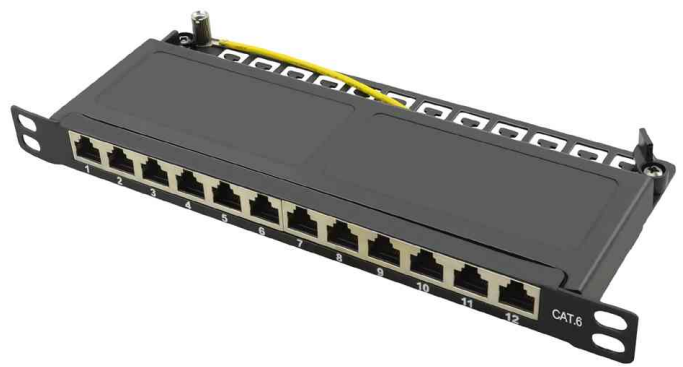
10" Patch Panel Kat.6, 0,5 HE, schwarz