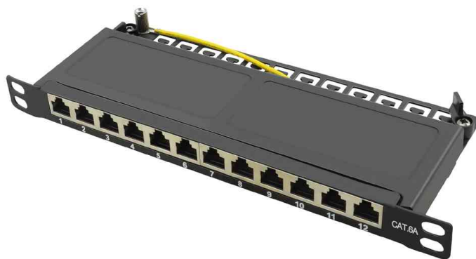
10" Patch Panel Kat.6A, 0,5 HE, schwarz