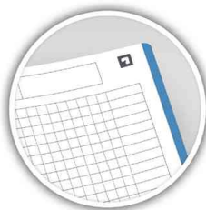
Detailansicht: Doppelspirale - farbige Ränder