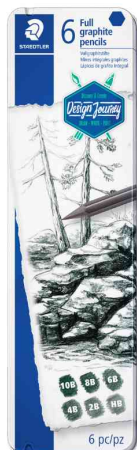
Graphitstift Mars Lumograph pure graphite, 6er Metalletui