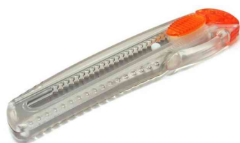
Cutter iL 120 P, orange