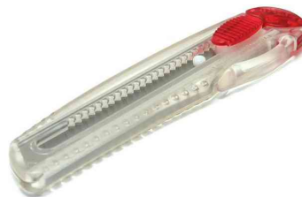
Cutter iL 120 P, rot