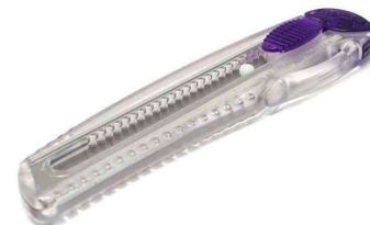
Cutter iL 120 P, violett