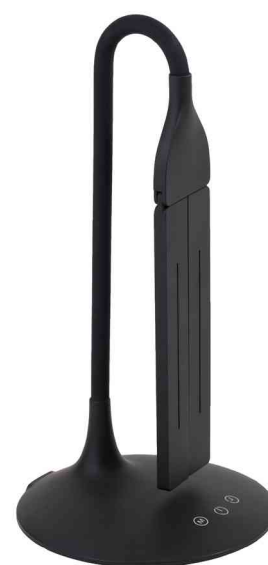
LED-Tischleuchte "TWIN", schwenkbarer Kopf