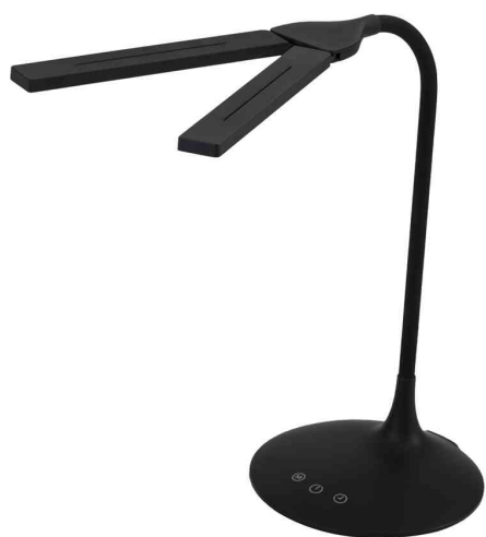
LED-Tischleuchte "LEDTWIN", schwarz