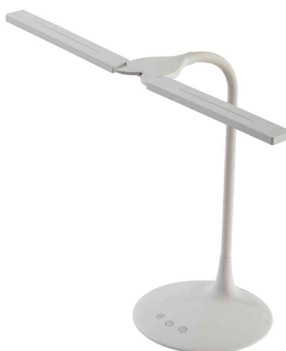
LED-Tischleuchte "LEDTWIN", weiß