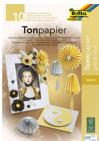
Tonpapierblock, gold / silber