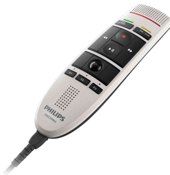
Diktiermikrofon SpeechMike III LFH3200