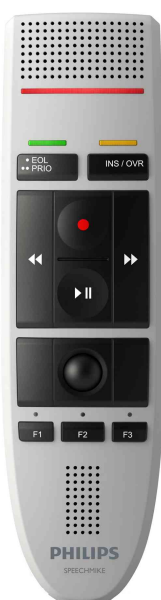
Diktiermikrofon SpeechMike III LFH3200