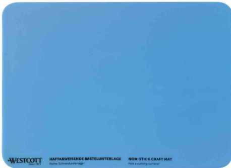
Bastelunterlage aus Silikon