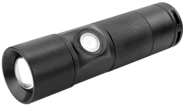
Akku LED-Taschenlampe Future T350FR