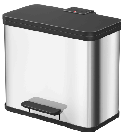
Öko Duo plus L, Edelstahl - silber