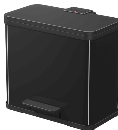
Öko Duo Plus L, schwarz