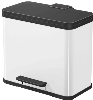
Öko Duo Plus L, weiß