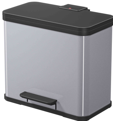
Öko Duo Plus L, Stahlblech - silber