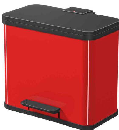
Öko Duo Plus L, rot