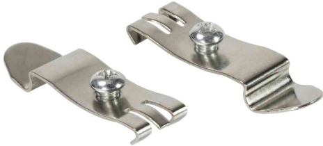
Hutschienenhalter mit Befestigungsschraube (M5), 2er Set