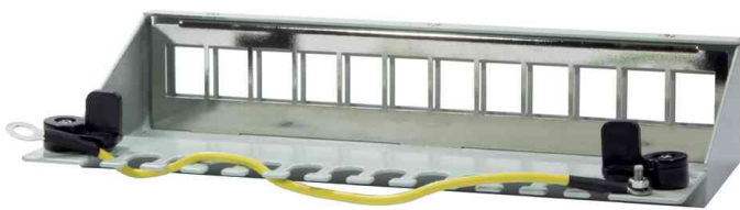
Stahlgehäuse für 12 Keystone Module