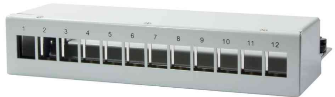
Stahlgehäuse für 12 Keystone Module