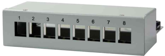
Stahlgehäuse für 8 Keystone Module