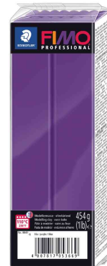
Modelliermasse PROFESSIONAL, lila