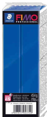
Modelliermasse PROFESSIONAL, ultramarin