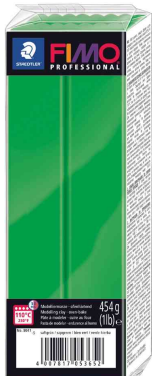
Modelliermasse PRO-FESSIONAL, saftgrün