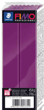
Modelliermasse PROFESSIONAL, violett