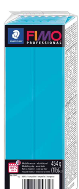
Modelliermasse PROFESSIONAL, türkis