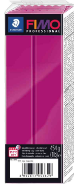
Modelliermasse PRO-FESSIONAL, reinmagenta