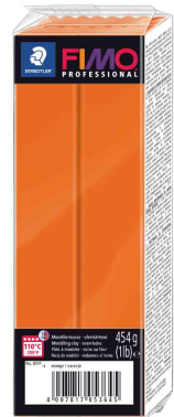
Modelliermasse PROFESSIONAL, orange