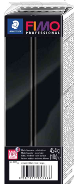
Modelliermasse PRO-FESSIONAL, schwarz