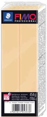
Modelliermasse PRO-FESSIONAL, champagner