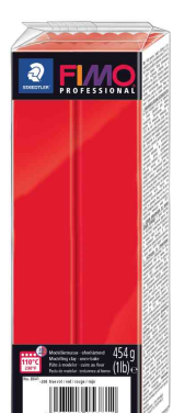
Modelliermasse PROFESSIONAL, reinrot