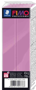
Modelliermasse PRO-FESSIONAL, lavendel