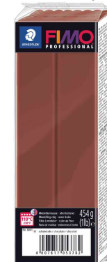
Modelliermasse PRO-FESSIONAL, schokolade