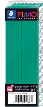
Modelliermasse PRO-FESSIONAL, reingrün