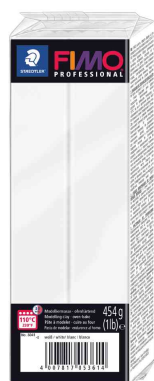
Modelliermasse PROFESSIONAL, weiß