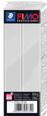
Modelliermasse PRO-FESSIONAL, delfingrau