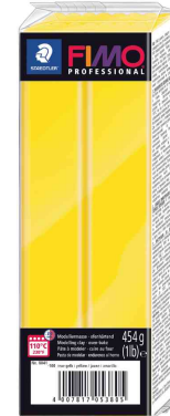
Modelliermasse PRO-FESSIONAL, reingelb