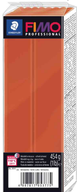
Modelliermasse PRO-FESSIONAL, terrakotta