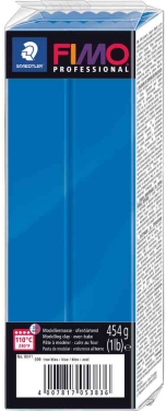
Modelliermasse PRO-FESSIONAL, reinblau