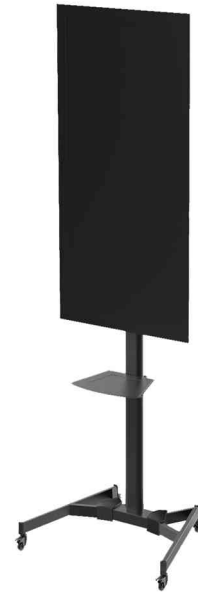
zeigt das Produkt in der Anwendung - Lieferung ohne Monitor