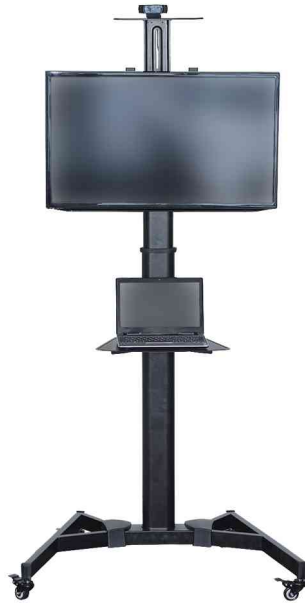
zeigt das Produkt in der Anwendung, Lieferung ohne Laptop und Monitor