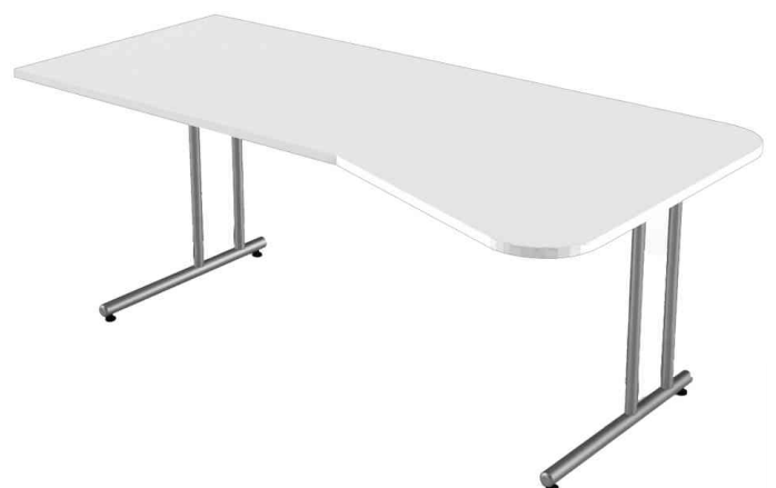
PC-Schreibtisch "Start Up", weiß