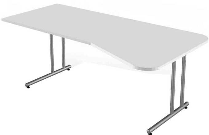
PC-Schreibtisch "Start Up", lichtgrau