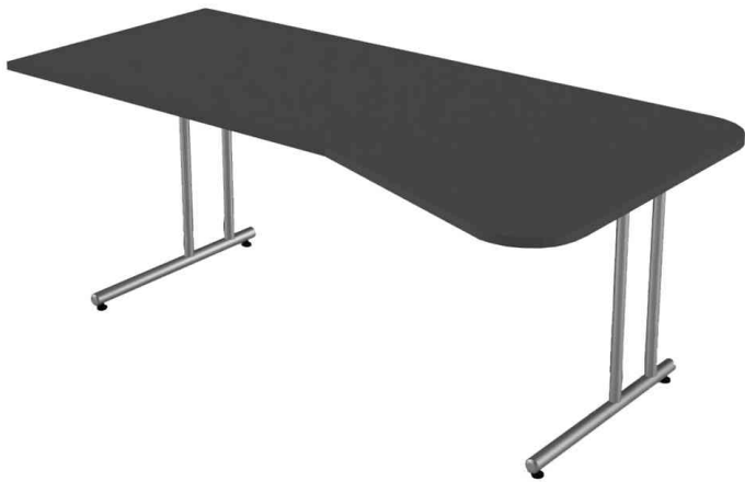
PC-Schreibtisch "Start Up", anthrazit

Die Lieferung erfolgt zerlegt - Montageservice auf Anfrage!