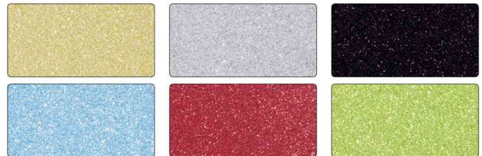
Glitterkarton-Block, Basic - Farben