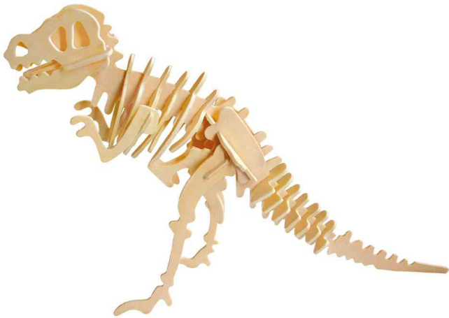
3D Puzzle "T-Rex Dinosaurier"

ACHTUNG! Nicht geeignet für Kinder unter 36 Monaten, wegen verschluckbarer Kleinteile.