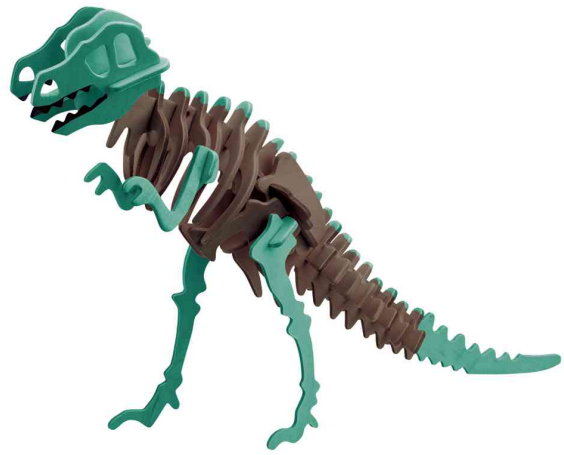
3D Puzzle "T-Rex Dinosaurier", Anwendung