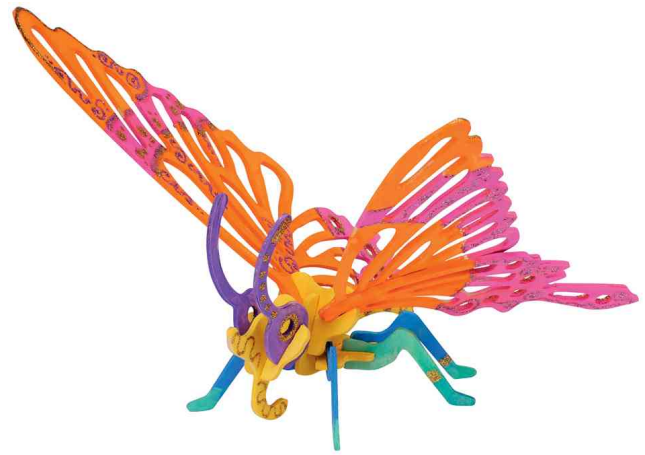
3D Puzzle "Schmetterling", Anwendung