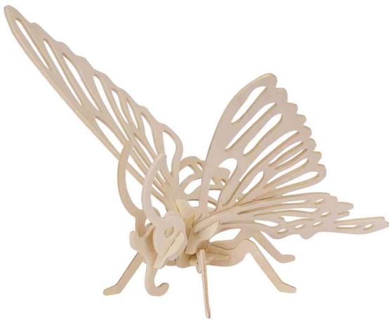
3D Puzzle "Schmetterling"

ACHTUNG! Nicht geeignet für Kinder unter 36 Monaten, wegen verschluckbarer Kleinteile.