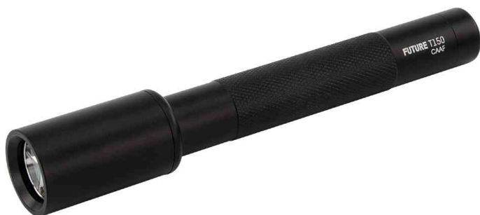
LED Taschenlampe Future T150